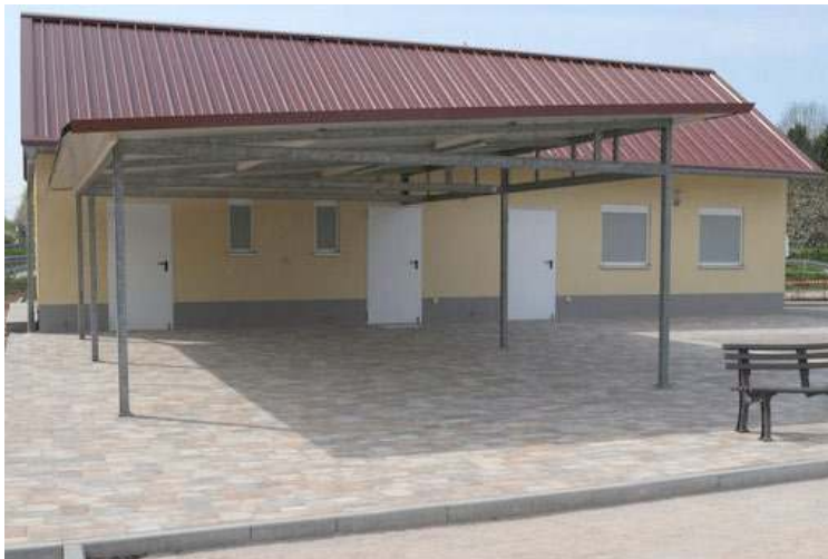
Das fertige Vereinsheim

Am 20. Mai 2017 konnte die Bouleanlage im Beisein des OB Demal und seines Stellvertreters Ehrlein feierlich eröffnet werden. In seiner Rede hob der Präsident der Wilden 13 die große Unterstützung der Stadt Stutensee und der vielen Helfer aus dem Verein hervor. Mit der neuen Anlage eröffnen sich dem Verein vollkommen neue Perspektiven. Mit dem neuen Vereinsgelände wurde ein kleines Juwel im Bereich der Bouleanlagen Baden-Württembergs errichtet, um das man uns zu Recht beneidet.