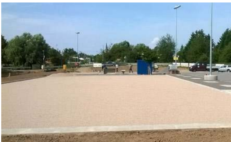
Es geht voran

Zwischen Ende der Bauarbeiten im Jahre 2001 bis 2014 war das Boulodrome an der Erich-Kästner-Straße die Heimat der Wilden 13, viel genutzt und Mittelpunkt vieler Veranstaltungen von Rotberzel-Cup bis Ligaspieltag. Im Herbst 2014 schlug die Bombe ein. Die Stadt Stutensee informierte den Verein, dass mit dem Neubau des Hallenbades und der damit verbundenen Verlegung des Festplatzes das Boulegelände weichen müsse. Unverzüglich aufgenommene Verhandlungen mit der Stadt konzentrierten sich anfangs auf mögliche neue Standorte und den Umfang der Neubaumaßnahme. Strittig dabei war zunächst vor allem die Finanzierung des Neubaus des Vereinsheimes. Sollte der Neubau in Eigenregie des Vereins oder der Stadt durchgeführt werden? In der Frage der Lage des neuen Geländes standen umfangreiche Untersuchungen an.