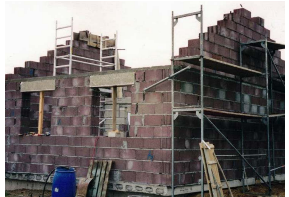
Rohbau im Winter