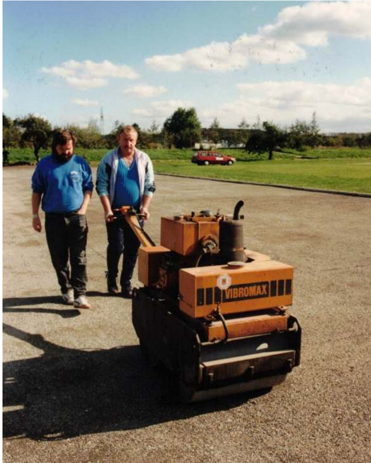
Wir machen alles platt