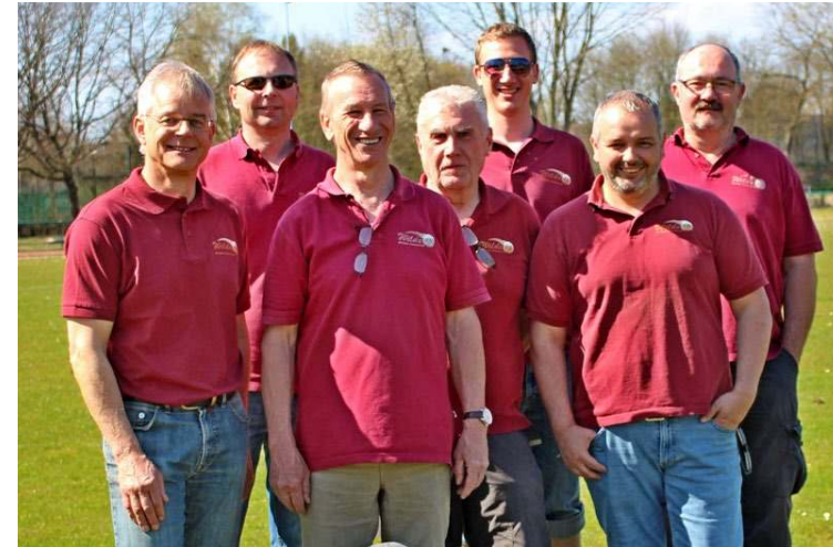
Meister der Landesliga und Aufsteiger 2019

Bereits vorher entdeckten einige Mitglieder ihr Faible für die ab 2006 durchgeführten Meisterschaften für Mannschaften 55 Jahre und älter, in Frankreich übrigens als Veterans benannt.