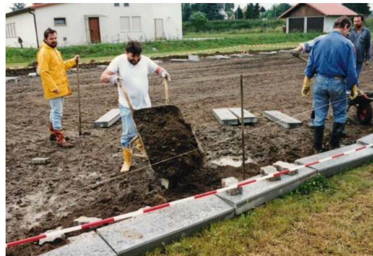
Wühlen im Schlamm

127 Kubikmeter Recyclingmaterial, 21 Kubikmeter Mineralbeton und 15 Kubikmeter Kalksand-Splitt-Gemisch wurden eingebaut, verdichtet und gewalzt.