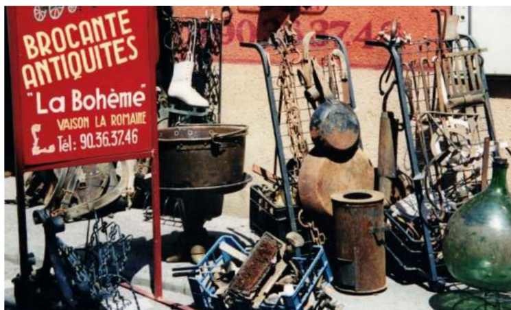
Markttag Vaison la Romaine

Das erste Ziel war 1997 Vaison la Romaine, eine Gemeinde im Departement Vaucluse, bekannt unter anderem wegen ihrer archäologischen Funde aus der Römerzeit.