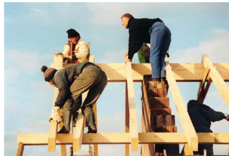
Wer steigt hier wem aufs Dach?

Bau hatte sich die Wilde 13 viel vorgenommen und angesichts der knappen Personaldecke schien dies manchmal zuviel zu sein. Letztlich wurde es aber in einer gemeinsamen Kraftanstrengung doch geschafft. Nach Fertigstellung der Terrasse im Frühjahr 2001 konnte die Wilde 13 stolz ihr neues Heim präsentieren. Die Überdachung der Terrasse im Juli/August 2005 war dann noch das Sahnehäubchen auf einer erfolgreichen zweiten Baumaßnahme.