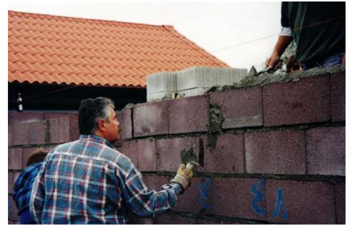
Guck mal, wer da mauert!