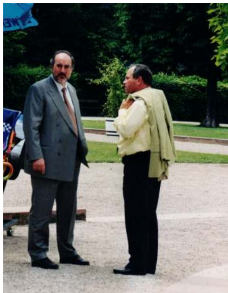
Die OB Demal Stutensee und Doll Bruchsal