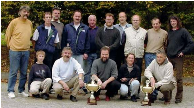
Pokalsieger 2001 BSG Wilde 13 Stutensee

Insgesamt gesehen fristeten die Stutensee'er meist in der Bezirksliga ihr sportliches Dasein. Der größte Erfolg in den Anfangsjahren war im Jahr 2000 der Gewinn des Mittelbadischen Ligapokals. In einer spannenden Begegnung konnte in der Halle in