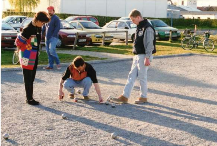
Heimspiel gegen BC Bruchsal

Insgesamt gesehen fristeten die Stutensee'er meist in der Bezirksliga ihr sportliches Dasein. Der größte Erfolg in den Anfangsjahren war im Jahr 2000 der Gewinn des Mittelbadischen Ligapokals. In einer spannenden Begegnung konnte in der Halle in