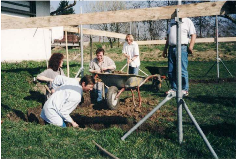
Ausheben des Kellers