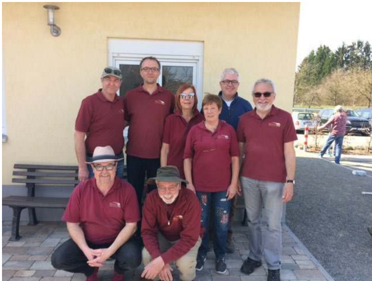
Zweite Mannschaft 2019

Mit der im Osten Mittelbadens eingerichteten Just-Liga wurde ein Gesamtsieger ausgespielt, etwas hochtrabend Championsleague genannt. 2011 wurde die Wilde 13 Gesamtsieger der Hardtliga und gleichzeitig Championsleague-Sieger. In den Folgejahren 2014, 2015 und 2017 wurde jeweils der zweite Platz in der Hardtliga errungen. Nach Fertigstellung der neuen Platzanlage ging es auch in der Liga wieder bergauf. 2018, wieder mit zwei Mannschaften am Start, gelang der Aufstieg in die Landesliga und völlig überraschend der Aufstieg der neugebildeten 2. Mannschaft in die Bezirksliga. 2019 dann der erstmalige Aufstieg einer Mannschaft der Wilden 13 in die Oberliga.